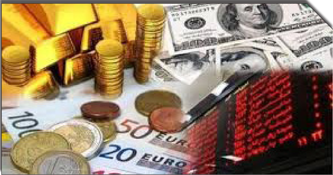
در سایت روزنامه خبوتیت

به بازار دلار بود که قیمت را دچار التهاب نموده و