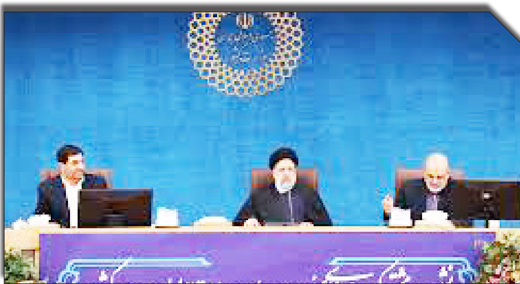
رئیس‌جمهور ایران در نشست مشترک با استانداران

رئیس‌جمهور گفت: آن‌چه دولت را می‌تواند بیشتر در دل مردم جای دهد و اعتماد مردم را افزون کند و اجتماعی را افزایش دهد، صداقت با مردم است.