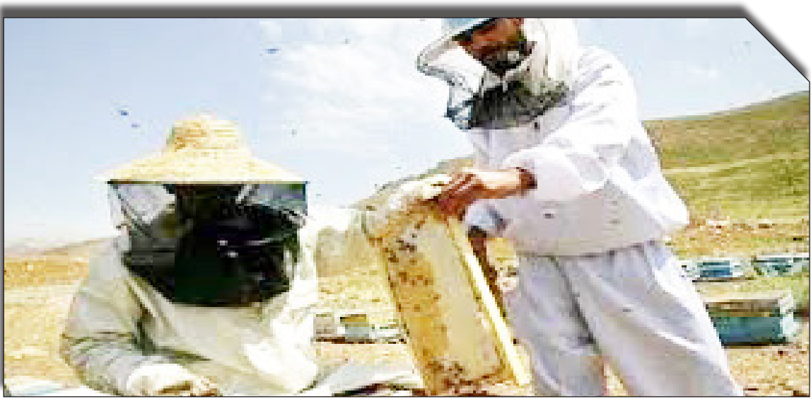
دریافت روزنامه بخوبیت

عسل و پرورش طیور، صیادی و ماهیگیری، نوغان‌داری، احیای مراتع و جنگل‌ها، باغات اشجار از هر قبیل و نخلیات از پرداخت مالیات معاف است.