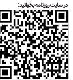
در سکت روزنامه به‌فوبیت

در کشور ما هم طبیعتاً نخبگان اقتصادی دارای شمایل و مختصات متفاوتی هستند که بعضی از آنها به واسطه ارتباطات گوناگون با صاحبان قدرت، دسترسی آسان به منابع مالی (رانت اقتصادی) یا شیوه‌های غیر متعارف به ثروت‌های آنچنانی دست یافته‌اند که هر از گاهی از آنها به عنوان کارآفرینان برتر هم تجلیل می‌شود!