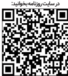
در ستاد روزنامه بخوابید

مسئولان ما نه‌تنها این افراد را مورد مؤاخذه قرار نمی‌دهند، بلکه برایشان دست و گاهی، سوت هم می‌زنند. از روی سکوی تماشاچیان تشویق‌شان می‌کنند و فریاد می‌زنند: «برو جلو، تو می‌تونی. کافیه تصور کنی که