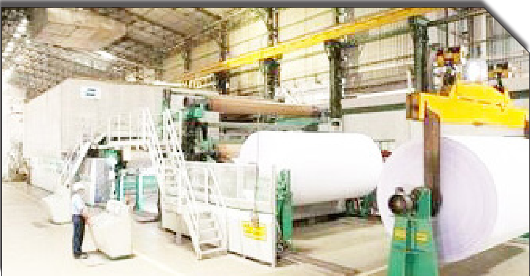
عصر اقتصاد: به گفته رئیس سندیکای

تولیدکنندگان کاغذ و مقوای ایران، حدود ۴۲۵ میلیون تن کاغذ در دنیا تولید می‌شود که سهم ایران ۱.۶ میلیون تن کاغذ است. این در حالیست که وزارت کار برای افزایش ظرفیت تولید کاغذ در کشور اعلام آمادگی کرد.