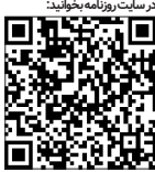
در ستاد روزنامه بخوابید

عدم توجه به اکوسیستم استارت‌آپی در کشور نیز چالش بزرگی است. در ادامه موضوع حمایت دولت از استارت‌آپ‌ها، باید به این نکته اشاره شود که حمایت‌های دولت صرفاً نباید در زمینه ارائه تسهیلات کم بهره باشد و موضوع بهبود اکوسیستم استارت‌آپی در کشور نیز یکی از اصلی‌ترین دغدغه‌های مدیران استارت‌آپ‌هاست. با اینکه