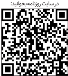
در ستاد روزنامه بخوابید

در همین راستا، کمیسیون مشترک جوانی جمعیت و حمایت از خانواده مجلس شورای اسلامی پس از ابلاغ سیاست‌های کلی خانواده، طرح جوانی جمعیت و حمایت از خانواده را به مجلس تقدیم کرد. در جلسه ۲۴ مهر ۱۴۰۰ کمیسیون، طرح جوانی جمعیت و حمایت از خانواده را براساس اصل ۸۵ قانون اساسی تصویب و پس از موافقت مجلس شورای اسلامی با اجرای آزمایشی آن به مدت هفت سال، دهم آبان ۱۴۰۰ موافقت کرد.