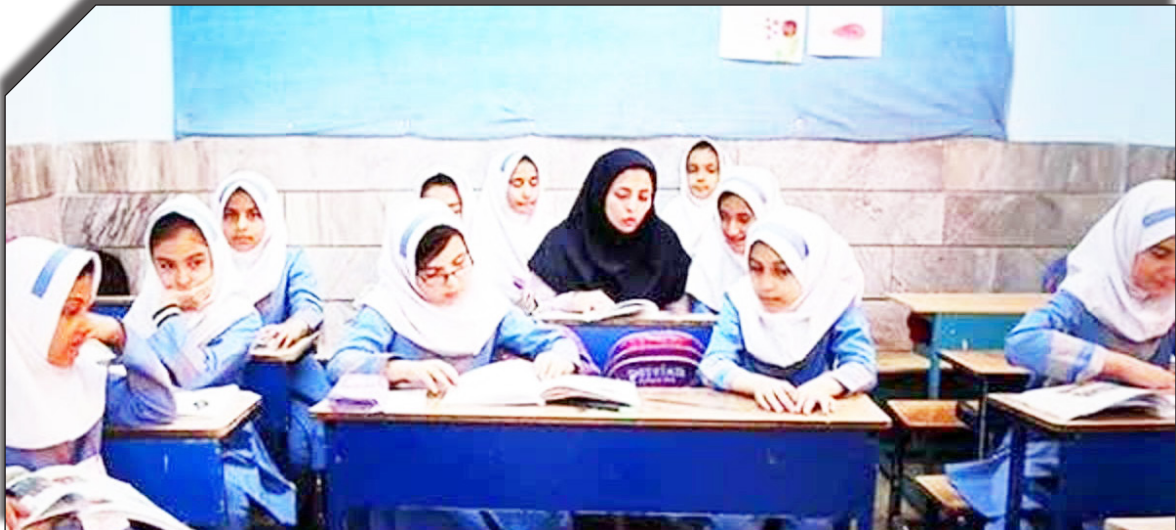
در سلامت و رفاه بهداشت