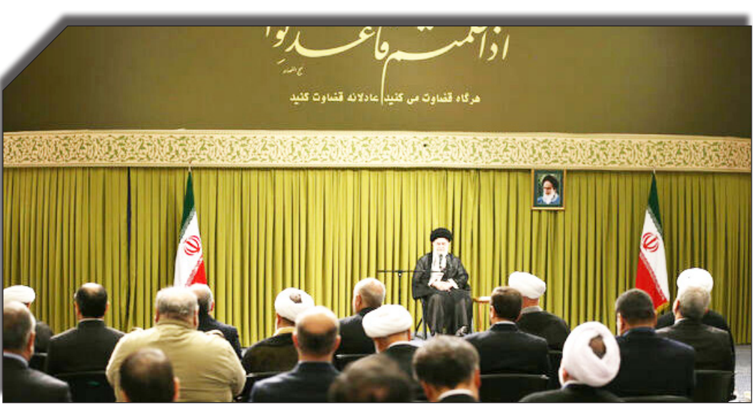
در سمت راست:روزانه‌تولید:

گزارش‌ها و شکایات به سازمان پزشکی قانونی که باید با اجرای اسناد دستگاه قضا، بهبود یابد.