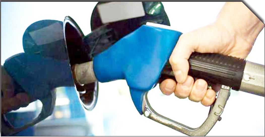
در سابت روزنامه یوتیوب

می‌شود؛ نمونه‌های بروز این مسئله و نتایج آن در سال‌های اخیر نیز مشهود است.