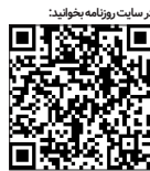
در سمت: روزانه بخونید!

است. احتمالاً ماهی‌هایی که حالا تبدیل به تن شده‌اند همگی در دولت قبلی به دنیا آمده‌اند، یا از نژادگان آن‌ها هستند! حتماً ماهی‌های دولت دوازدهم رنگی به کفش‌شان بوده و می‌خواستند بی‌خودی خودش‌ان را گران کنند. آن‌ها به‌صورت کاملاً سیستماتیک و برنامه‌ریزی شده طی چند سال زیر آب‌ها همیشه نقش تعیین‌کننده‌ای در نقش این آبرافان غلب بود. شاید قلعهٔ حیواناتی این بار زیر آب و در عمیق‌ترین قسمت‌های دریا ساخته شده باشد.