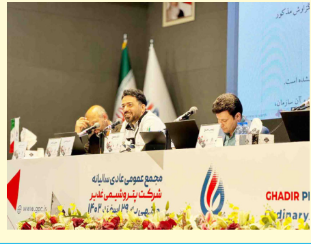
از سمت راست

در پایان این مجمع، ۷۰۰۵۷۰ریال سود به ازای هر سهم «شغدیر» بین سهامداران تقسیم شد.