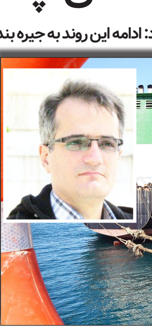
راه‌اندازی بازار بهینه‌سازی انرژی است و

اینکه جایگاه صنعت گاز در کشور بسیار مهم است و خدمات بسیاری به آحاد مردم و بخش‌های مختلف ارائه می‌شود که قابل توصیف نیستند، اظهار کرد: طی سه سال اخیر دستاوردهای مهمی در حوزه گاز و تأمین انرژی حاصل شد که یکی از آن‌ها