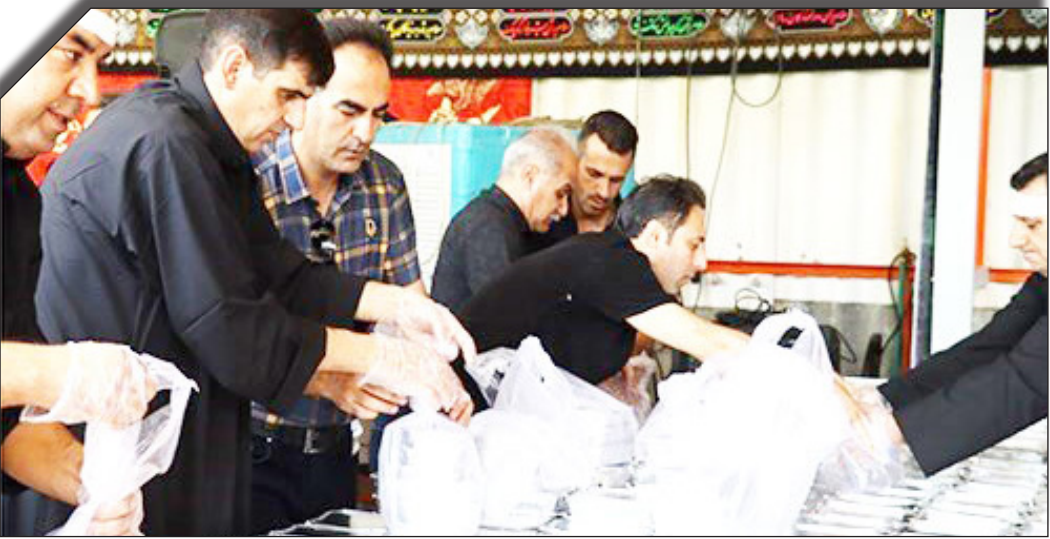
درصحنه توزیع اقلام

برادری تصریح کرد: هیأت مذهبی می‌توانند با در دست داشتن معرفی نامه به سردخانه‌های تهرانپارس و هشت شهریور برای دریافت گوشت قرمز منجمد و گوشت مرغ، ۳۲۰۵ تن برنج و ۱۴۰۰ تن شکر و گوشت مرغ، ۳۰۰ هزار تومان و گوشت