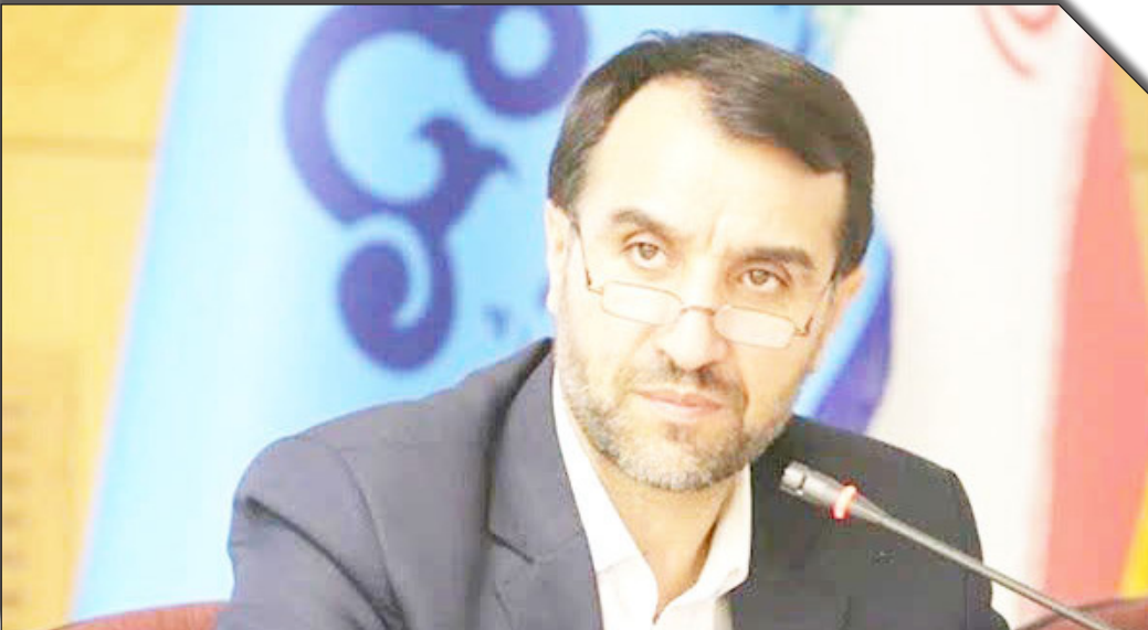
در سایت روزنامه‌خبرآنلاین

معاون وزیر نفت در امور پتروشیمی با بیان اینکه زنجیره محصولات پتروشیمی تا هفت سال آینده تکمیل خواهد شد، خاطرنشان کرد: ازآن‌جایی که تأکید مهم مقام