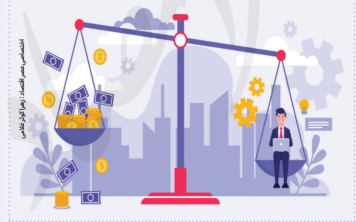
اختصاصی عصر اقتصاد : رهزنا کوثر غلامی