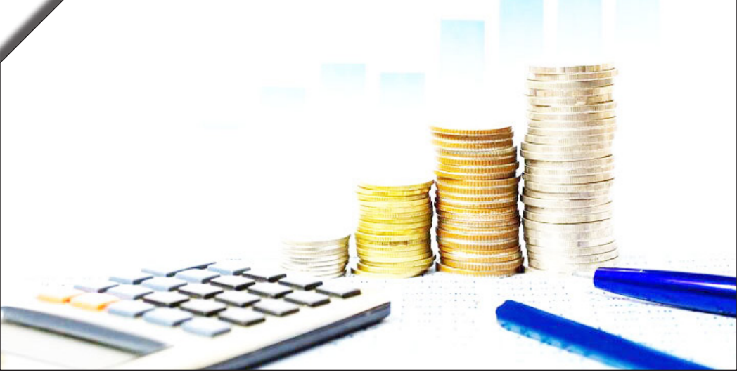
درسات روزنامه بختیاب

وی بیان کرد: در سال‌های اخیر اهمیت نقش مالیات در تأمین بودجه برای توسعه کشور با عبور از وابستگی به نفت مشخص شده اما آنچه که کمتر به آن پرداخت شده بودش گرفتند؛ اما باز هم به این سازمان کمک کردند.