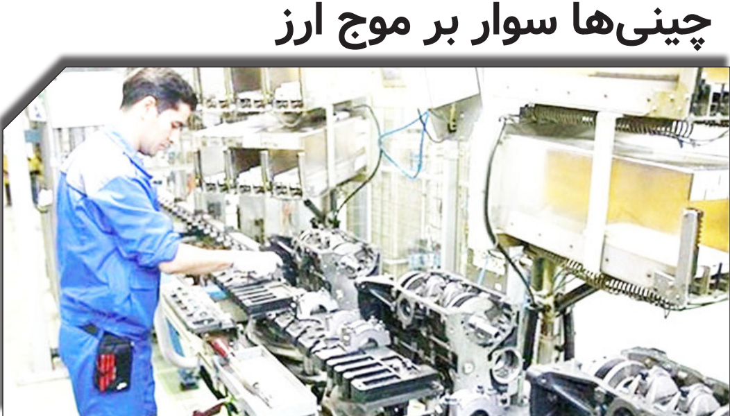
در سایت روزنامه خوراندی.