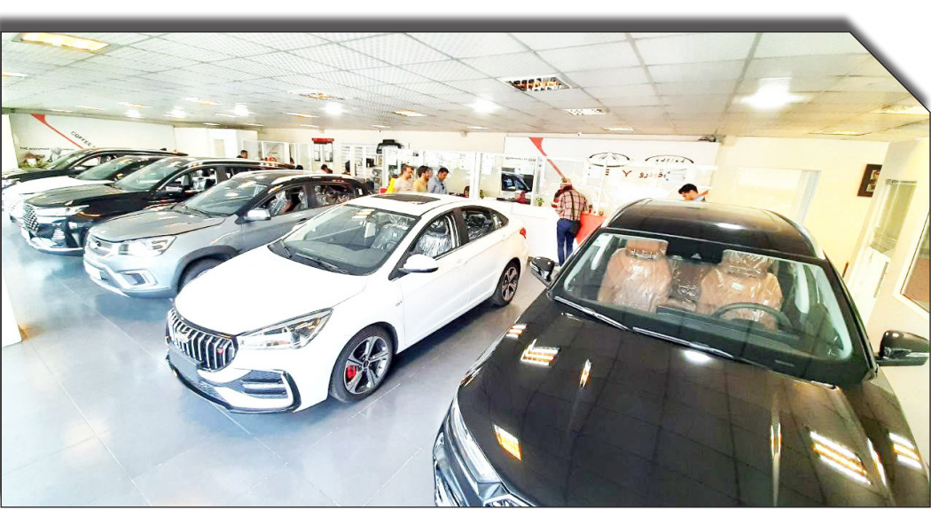
در سمت راست: روزنامه‌خوبلید:

دلار فراتر رفته و این کشور اکنون جزو ۱۴ کشور برتر زنجیره تامین بین‌المللی و خودروسازی شناخته می‌شود.