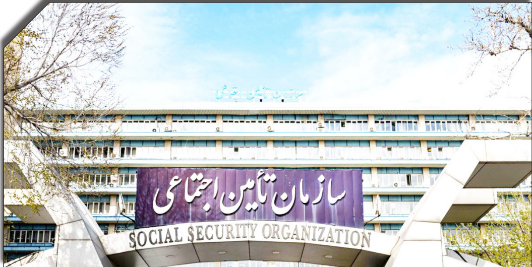
درتامن روزنامه‌های پولیتا

۱۴۰۱ به مبلغ ۵۹۲ هزار میلیارد تومان، در حال طی فرایند رسیدگی حسابرسی است. همچنین در ارتباط با ابهامات مطرح شده در خصوص نحوه بروزرسانی مطالبات مشروط به اخذ شناسه تعهدات از سازمان برنامه و بودجه کشور مورد پذیرش قرار گرفته است. همچنین مطالبات ادعایی سازمان مذکور برای مقطع پایان سال