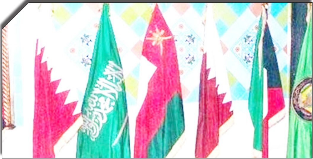
در شب روزنامه یونایتد