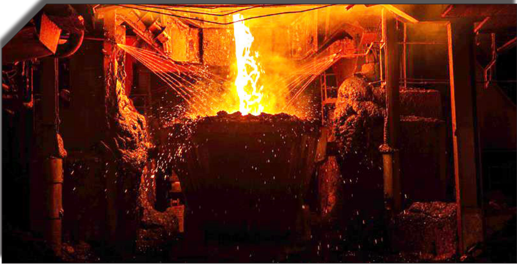
در سایت روزنامه بختال