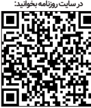
در سایت روزنامه بصورت