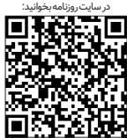
در سایت روزنامه بصورت

کشور باید این مقوله را به عنوان یک مطالبه جدی پیگیری کنند، اما یادمان باشد استفاده همزمان از چند کولر در یک واحد ساختمانی و باز گذاشتن لای پنجره برای تنظیم دما هم به هیچ عنوان منطقی نیست.