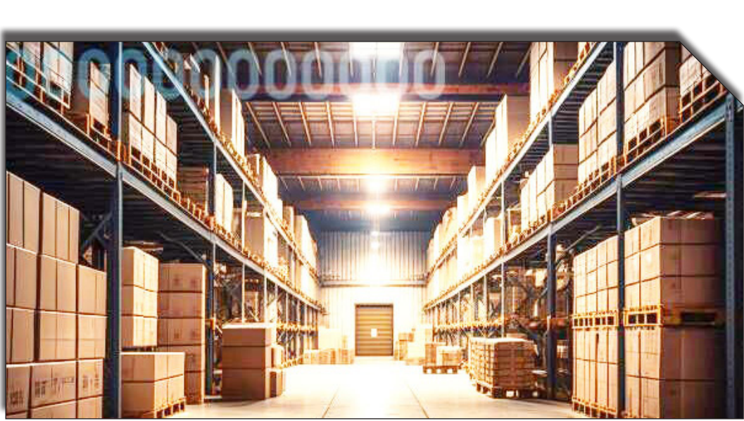
دراست، روزنامه بخت‌دل: