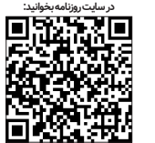
در سایت روزنامه بصورت

قصد بررسی نحوه زندگی گذشتگان و مقایسه آن با افراد کنونی جامعه و یا مقایسه سبک زندگی و میزان مصرف انرژی در کشورهای اروپایی را با کشور خودمان ندارم. چرا که اگر قرار باشد میزان مصرف انرژی ما یا آنها مقایسه شود خیلی از موارد دیگر نظیر ایمنی خودروها و جاده ها، سرعت اینترنت، سرانه فضاهای ورزشی، میزان تورم و ... نیز را با آن کشورها مقایسه کرد! اما باید خاطر نشان کرد، رعایت الگوی مصرف انرژی در دنیا به یکی از اصولی ترین و بدیهی ترین ملاحظات جوامع بشری تبدیل شده