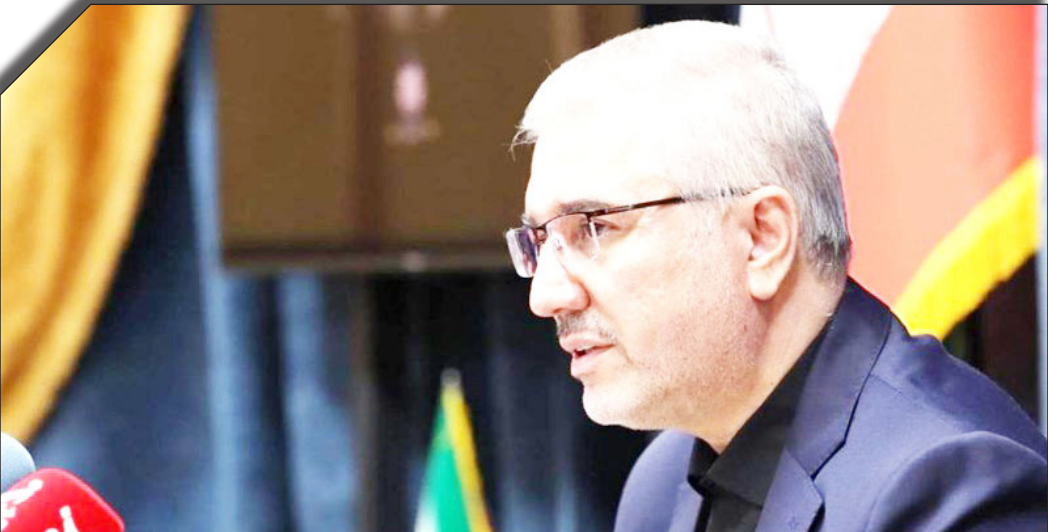
در سایت برنامه بودجیات

خزانه را به طور قابل اطمینان به دولت جدید تحویل می‌دهیم به گفته معاون رئیس جمهور، در چهار ماه اول سال ۸۶ درصد پرداخت انجام دادیم البته تا پایان سال عمدتاً می‌رود تا ۹۸ درصد