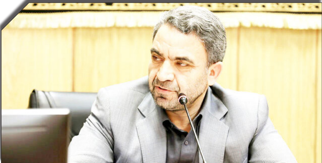
مدیرکل آموزش و پرورش