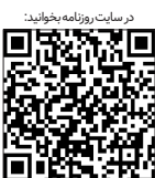
در سایت روزنامه بخت‌نویس

در حقیقت اوقات فراغت تنها محدود به انجام بازی های فکری و جسمی نیست و گاهی اوقات می‌توان با فراهم کردن بستر یادگیری و تکانش ذهنی دانش آموزان از همان سنین کودکی، زمینه های خلاقیت اقتصادی را در نهادشان بارور ساخت.