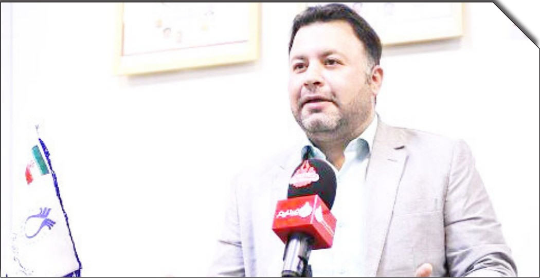
عصر اقتصاد: در وصف اوضاع صنعت

لبنیات کافی است تا به تعریف تراژدی، بپردازیم. تراژدی داستانی است که در آن زنجیرهٔ حوادث جبری، شخصیت اصلی یا همهٔ شخصیت‌ها را به سوی سرنوشت ناگوار و فاجعه‌آمیز سوق می‌دهد.