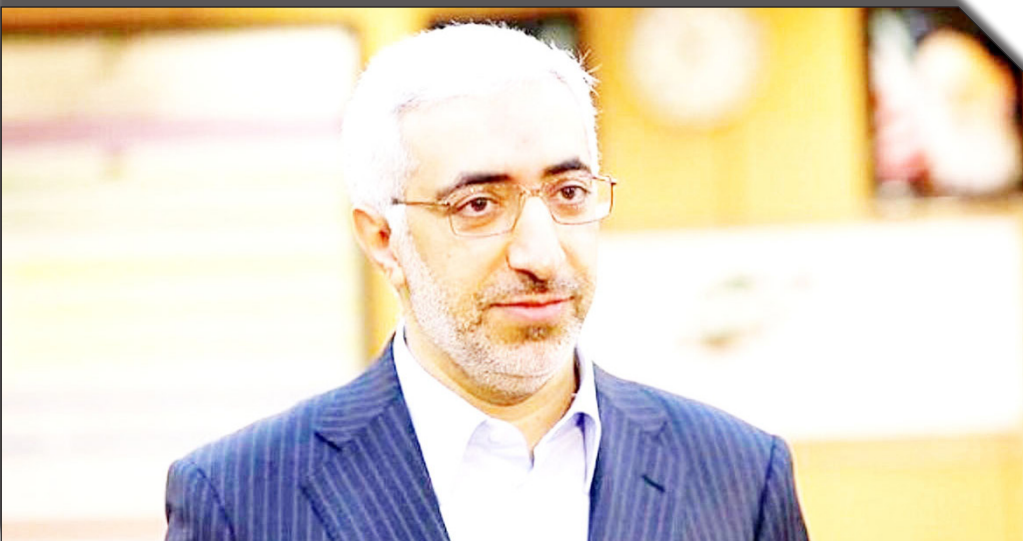
در نشست ویژه باوولایت

عصراقتصاد: بنابراعلام رئیس سازمان بورس و اوراق بهادار، در جلسه روزدوشنبه شورای عالی بورس، موضوع انتشار اوراق سلف ارزی در بورس کالا مطرح شد و شورا با کلیات آن موافقت کرد. به این ترتیب، شرکت‌های صادرات محوری که نیازمند تامین مالی هستند، می‌توانند از طریق انتشار این اوراق، در بورس کالا، تامین مالی کنند.