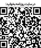
در سایت روزنامه بصورت آنلاین

انتقال چند بسته دارویی هزینه کل سفر خود را تأمین می‌کردند. در ادامه تصریح کرد: در جلسه‌ای یکی از صادرکنندگان عنوان کرد همه مهمانداران و خلبانان دارو ترانزیت می‌کنند؛ چون برای تأمین داروهای گران‌قیمت خارجی اروپایی ارز ۴۲۰۰ تومانی داده می‌شد همان