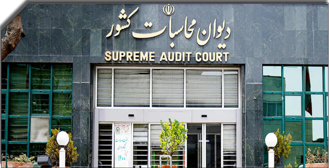
در سایت روزنامه بختواند:

مرکزی در سال ۱۴۰۲، مبلغ ۴۰۴ همت نیز به صورت تنخواه به سازمان هدفمندسازی یارانه‌ها پرداخت نموده است.