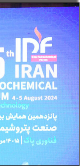
در سایت روزنامه بخت‌والید

هلدینگ‌های پتروشیمی در بالادست صنعت نفت برای تأمین خوراک پایدار اشاره و بیان کرد: این اقدام از اولویت‌های صنعت پتروشیمی نیست اما در زمان کنونی این صنعت از هیچ اقدامی برای توسعه کشور و تکمیل زنجیره ارزش کوتاهی نمی‌کند.