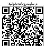
در سرت روزنامه بختیاری

مثلاً اگر بچه‌ای پستانک بخورد و از آن بدتر، با مرهٔ شیر خشک آشنا شود دیگر حاضر نیست در کنار خود خواهر و برادری را ببذیرد. از طرفی، وقتی پدر و مادری برای فرزند خود شیر خشک و پستانک بگیرند؛ یعنی هنوز ته جیبشان پول وجود دارد، پس غلط می‌کنند به