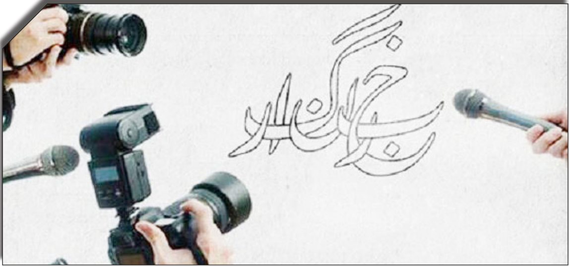
در سایت روزنامه پخوبود

مشکلات اقتصادی خبرنگاران می‌گوید: مدیریت رسانه‌های کشور بسیار منبعث از اوضاع اقتصادی کشور است به نحوی که امروز اگر بنا به زندگی با حقوق حداقلی رسانه‌ها باشد، این شغل جذباتی ندارد و لذا ناگزیر به خلاقیت هستم .