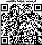
در سایت روزنامه بصفتیاد