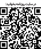
در سایت روزنامه بصورت آنلاین

۴. چرا بیش از دو برابر بیشتر از سال ۱۳۹۹ ارز که عمدتاً ترجیحی بوده است، برای واردات مواد اولیه پوشک تخصیص داده‌اند؟ مگر تولید پوشک افزایش داشته است؟ مابه