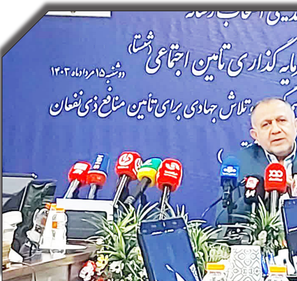
دراست روزانه بخوانید

سالانه بیش از ۱۴ میلیارد دلار صرفه جویی برای کشور دارد.