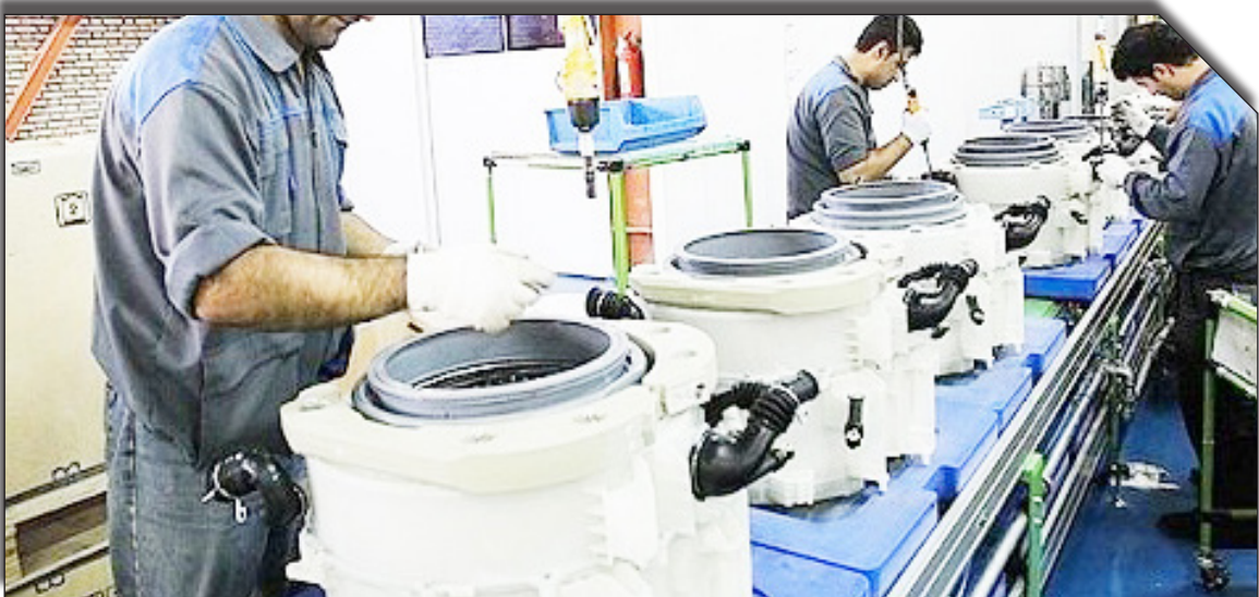
فرستاده شده به جهت