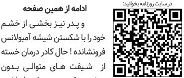
در ساعت روزنامه‌نویسی

هلدینگ خلیج فارس رقم بزنیم. مدیرعامل گروه صنایع پتروشیمی خلیج فارس در ادامه با تبریک به رئیس‌جمهور و وزیر نفت افزود: شرکت صنایع پتروشیمی خلیج فارس، یک شرکت مردمی و متعلق به مردم ایران است و ما امانت‌دار مردم و سهام‌داران هستیم و امیدواریم که بتوانیم به بهترین وجه وظایف خود را انجام دهیم؛ حرکت امروز هلدینگ خلیج‌فارس بسیار خوب و در روندی موفقیت‌آمیز و درخشان است. وی در این اجلاس، با اشاره به جایگاه گروه صنایع پتروشیمی خلیج‌فارس ادامه داد: امروز هزاران کارخانه در صنایع نساجی، چرم، کفش، کیف، لباس که احتیاج به محصولات پتروشیمی دارند را حمایت می‌کنیم.