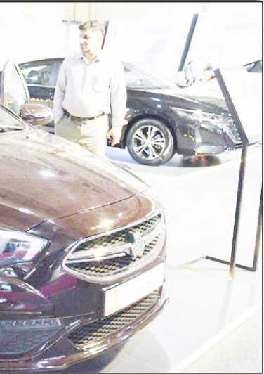
در سایت روزنامه بخت‌ناشد