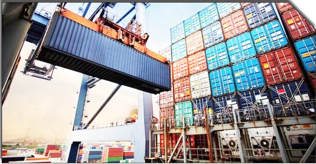
درصدها و رونامه‌های صادرات

معاون وزیر اقتصاد تصریح کرد: میزان واردات از کشورهای همسایه در ۶ ماهه سال جاری از ۶ میلیارد و ۶۰۰ میلیون دلار رسید.