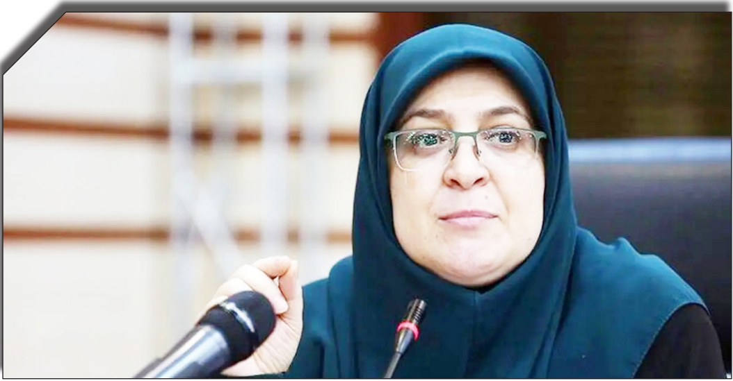
در سایت روزنامه خوبانید