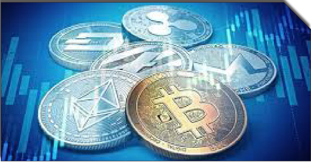
در سمت راست: رمزپول‌ها:بیت‌کوین

عصراققتصاد: معاون فناوری های نوین بانک مرکزی اعلام کرد: پیش‌نویس سند مشتمل بر دامنه ورود بانک مرکزی و نقش سایر دستگاه‌ها جهت تنظیم‌گری حوزه رمزپول‌ها تدوین شده و مقرر است در ادامه، نظرات فعالان، دستگاه‌های