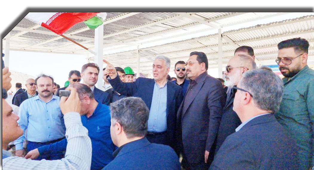
در سابت روزنامه بخوانید

روزافزون مس در دنیا، محصول این کارخانه قابلیت صادرات به کشورهای منطقه را داشته که درآمد حدوداً ۳۰۰ میلیون دلاری را برای این استان به همراه دارد و تحولات اقتصادی، فرهنگی و اجتماعی جدی را در این منطقه رقم خواهد زد.