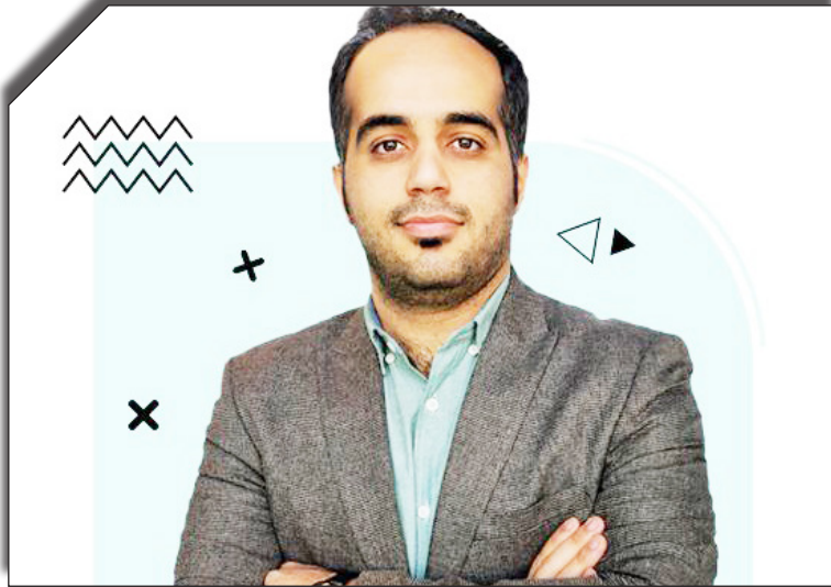
درست روزنامه پلنت