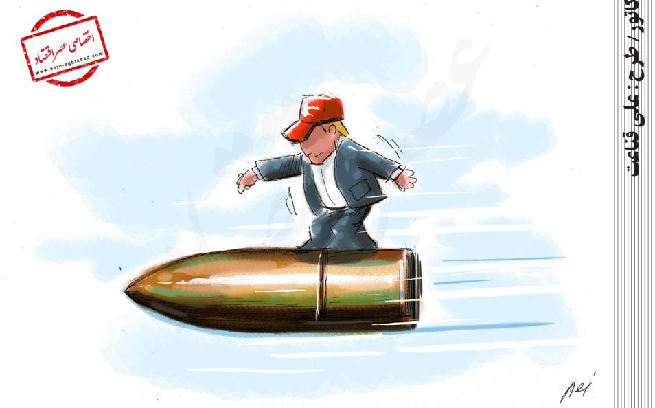
کاریکاتور / طرح: علی قناعت