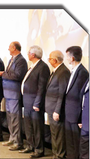
در سالیانه پروژانه تولیدات