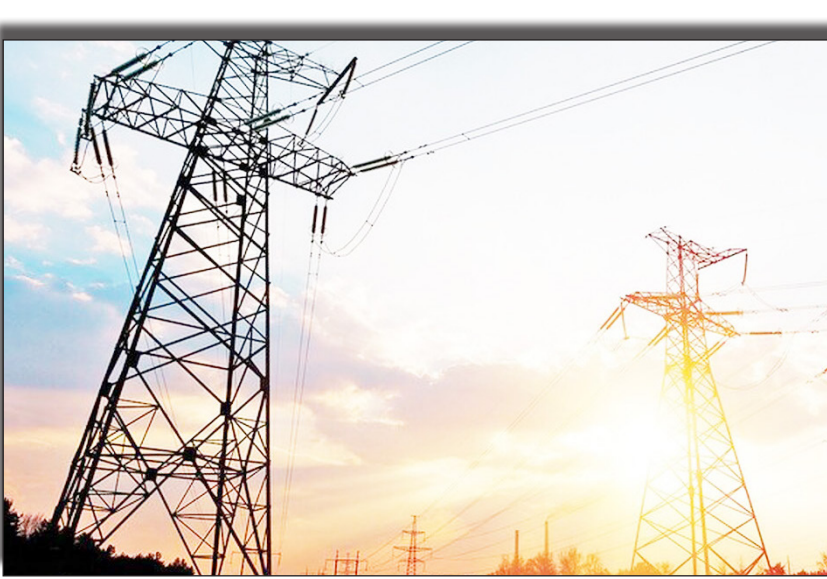
درختان روبانامه خواداد

سال‌هاهمانگی های لازم را وزارت نفت و شرکت های تابعه انجام داده است، اما به دلیل محدودیت هایی که در حوزه تأمین سوخت زمستانه وجود دارد، نیاز است مشترکان بخش خانگی برای تأمین حداکثری برق و گاز رزستان به صورت کلی نسبت به صرفه جویی در حوزه انرژی اقدام کنند.