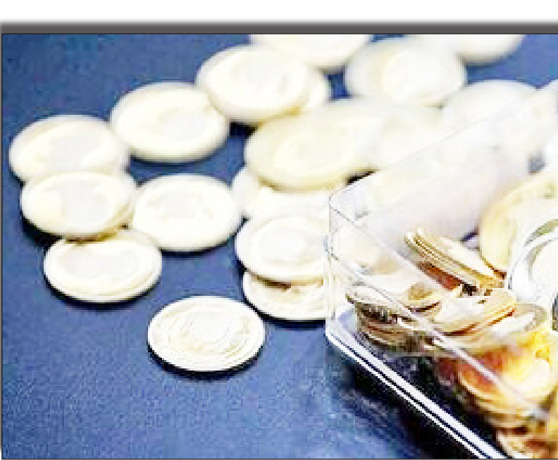
درسات روزانه به‌ویادیت

رکورد جدید قیمتی طلا است. روز پنجشنبه در آخرین معاملات، هر اونس طلا ۲۷۳۸ دلار بود که به نسبت ابتدای هفته با ۱۷ دلار افزایش بطور متوسط همراه بود؛ امروز، تا این لحظه ۱۰ دلار از هر اونس طلا کاسته شده و در هر حال حاضر، هر اونس طلا، ۲۷۲۸ دلار قیمت دارد.