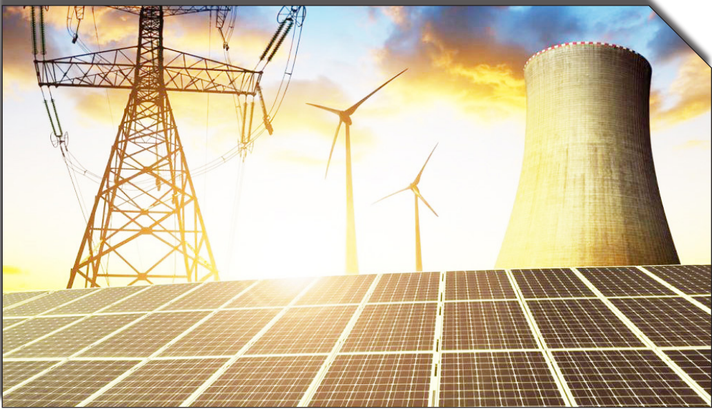
درابت روزانه پخشایند

است از محل ادغام سازمان بهینه سازی مصرف سوخت، ستاد مدیریت حمل و نقل و سوخت و بخش بهره وری سازمان ساتبا تشکیل شود.