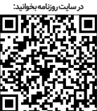
در سایت روزنامه بخوانید:

اصلاح قوانین مبارزه با پولشویی و تأمین مالی تروریسم وضع کند. این اصلاحات می‌تواند به کاهش فساد مالی در کشور منجر شود؛ به‌طوری‌که کشورهایی که با FATF همگام شده‌اند، معمولاً شاهد کاهش ۱۰ تا ۱۵ درصدی شاخص‌های فساد بوده‌اند.