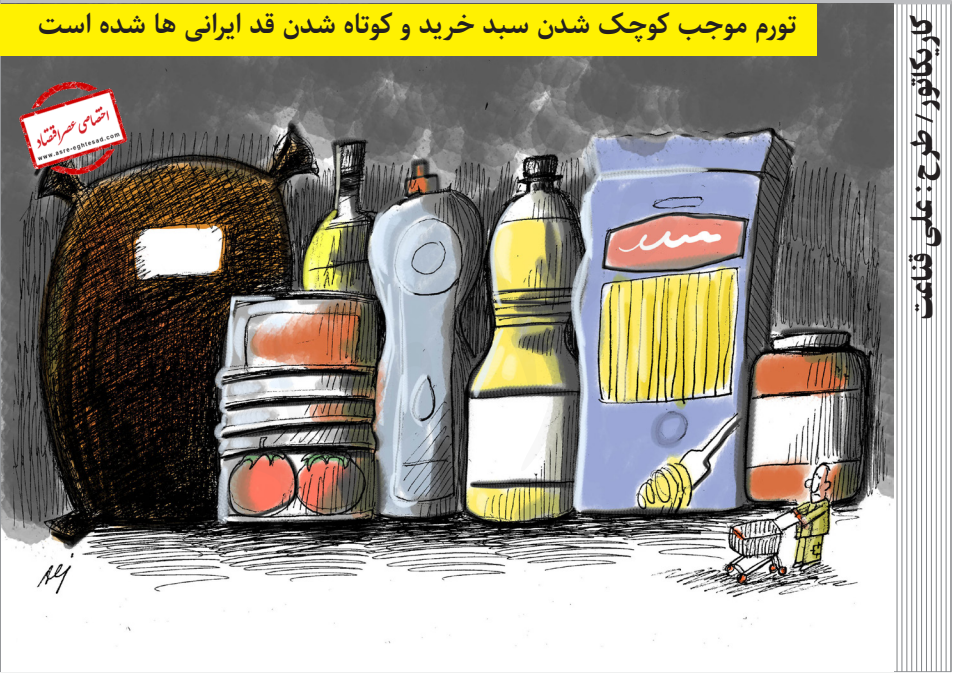
تورم موجب کوچک شدن سبد خرید و کوتاه شدن قد ایرانی ها شده است

آسیب‌شناسی لایحه اصلاح قانون تجارت؛ اصلاح یا شخم زدن قانون! (بخش نخست)