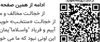
در سایت روزنامه بخت‌بویید

آسیب‌شناسی لایحه اصلاح قانون تجارت؛ اصلاح یا شخم زدن قانون! (بخش نخست)