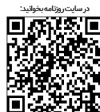
در سایت روزنامه بخت‌بویید