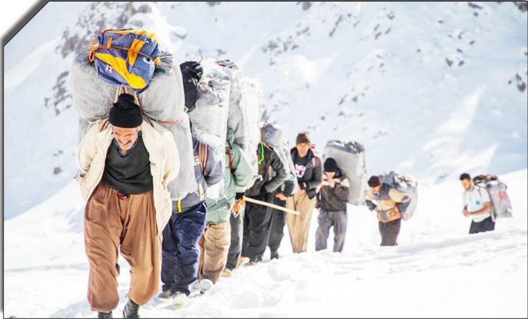
در سبب روزنامه پخوانید