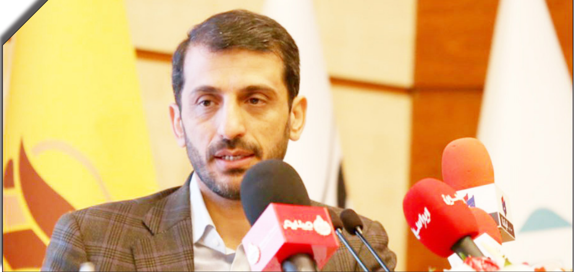
در سمت راست: روزنامه‌پولیت

وی افزود: هم‌افزایی با فولاد سنگان به‌عنوان بزرگترین مجموعه صنعتی منطقه خواف، از دیگر اهداف فولاد مبارکه در خرید اپال بوده است، مجموعه‌ای که در منطقه خراسان در مسایلی اپال قرار دارد و توسعه‌های هدفمندی از جمله تولید ۵ میلیون تن کانسازنه و ۵ میلیون تن گندله برای آن