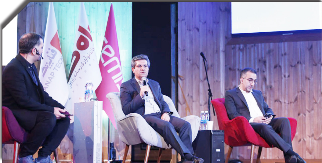
در ساعت روزنامه‌یپولیتیک

هیئتمدیره شرکت ارتباطات زیرساخت، در ادامه پزل بیان کرد: «سرمایه‌گذاری در حوزه ارتباطات با تعرفه‌های فعلی اقتصادی نیست. تعرفه‌ها باید به طور منطقی افزایش پیدا کنند تا بتوانیم به توسعه زیرساخت بپردازیم. اگر سیاست‌های کلی اقتصاد دیجیتال و قراردادها به وضوح تعریف شوند، شاید بتوانیم برخی از مشکلات موجود را برطرف کنیم.» کاشی تأکید کرد که مشکل تنها به بحث تعرفه‌ها محدود نمی‌شود و مسائل کلان‌تری مانند عدم هماهنگی میان نهادهای تصمیم‌گیرنده و ضعف زیرساخت‌گذاری‌های مرتبط با اقتصاد دیجیتال نیز نقش مهمی در این مشکلات دارند.