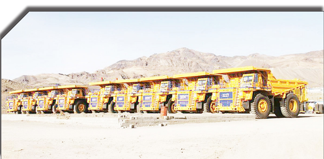
در سایت روزنامه بخت‌آید.