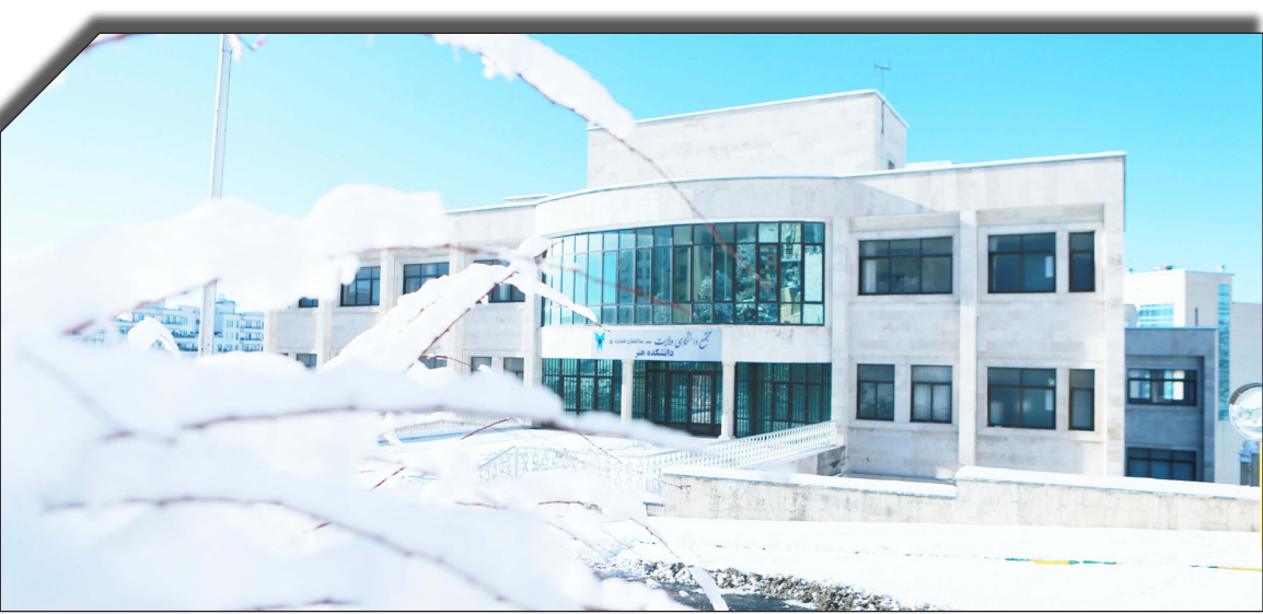
در سایت روزنامه‌خوبانیت

وی در ادامه اظهار داشت: با توجه به اینکه اکثر دانشجویان دانشگاه آزاد بخصوص در رشته زیست شناسی برای گذراندن پایان نامه مجبور به همکاری با اساتید خارج از دانشگاه و اساتید دانشگاه های دولتی هستند باید هزینه جداگانه برای این همکاری پرداخت کنند و با توجه به اینکه برای ۱۸ واحد پایان نامه هزینه زیادی پرداخت می کنیم و دانشگاه هیچ گونه کمک هزینه و امکاناتی به دانشجو برای گذراندن پایان نامه اش نمی دهد.