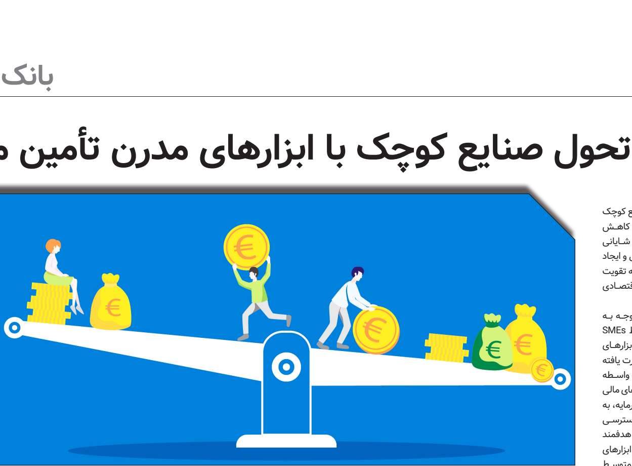
در سایت روزنامه‌هایخبریت

خورسندیان با اشاره به ط مراحل قانونی و صدور مجوزهای لازم در راستای افزایش ۱۰۰ همتی سرمایه بانک مسکن در دولت و مجلس، حمایت‌های دولت و مجلس شورای اسلامی را در راستای این مهم خوشاستار و یادآور شد: بانک مسکن نیز پس از تحقق افزایش سرمایه و به پاس قدردانی از این حمایت ارزشمند، با گذشتة و با تمام قوا، فعالیت خود را در حوزه مسکن و اجرای تکالیف محوله دولت محترم به خصوص طرح نهفت ملی مسکن توسعه خواهد داد.