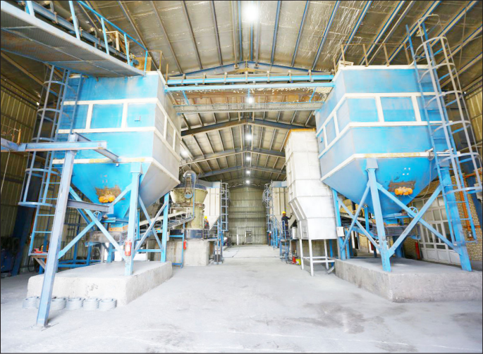
درسامت روزنامه بخوابید

این شرکت ظرفیت تولید سالانه ۱۰۰ هزار تن پودر بنتونیت دارد که یکی از مواد اولیه مورد نیاز در تولید گندله است و در تامین نیاز شرکت صنایع فولاد سنگان نقش چشمگیری دارد.