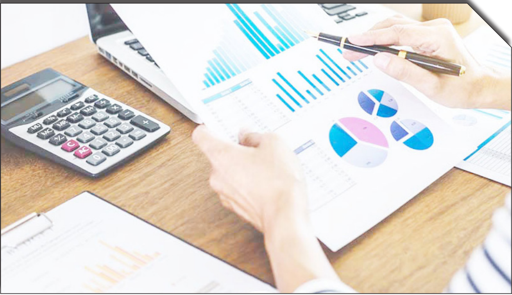
دست‌نویس‌ها و یک ماشین‌حساب

بحث‌برانگیز در حوزه حسابداری است که به توجه بیشتری نیاز دارد.