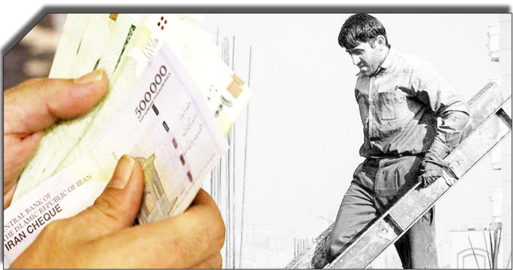
دراست روزنامه بختیار