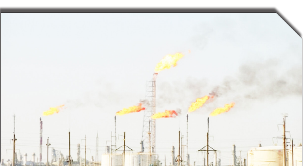
دریافت روزانه تولید

کسری انرژی بلای جان اقتصاد ایران شد نگاهی به فهرست کشورهای دارای مهمترین ذخایر منابع طبیعی نشان می دهد که بیشتر آنها توانسته اند با تکیه به درآمدهای حاصل از این منابع سرمایه گذاری های موفق‌ی را داشته و در مسیر توسعه قرار گیرند. در میان این کشورها هم هستند کشورهایی همچون ایران و ونزوئلا که بهره چندانی از این منابع خدادادی نبرده اند.