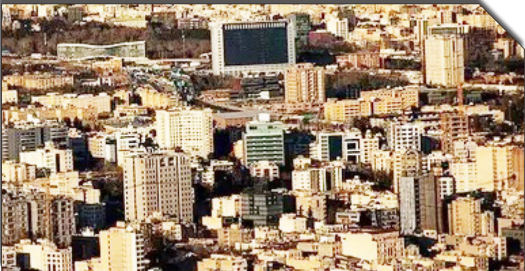
در سایت روزنامه‌بختوانید

درصد افزایش یافت و به نظر می‌رسد روند بازگشت بازار به مدار رشد ادامه داشته باشد. این افزایش عمدتاً به دلیل افزایش تقاضا در بخش‌های صادراتی، نظیر پتروشیمی‌ها، فولاد و محصولات معدنی بوده است. همچنین رشد قیمت جهانی نفت و فلزات گرانبها نیز بر این افزایش تاثیرگذار بوده است.