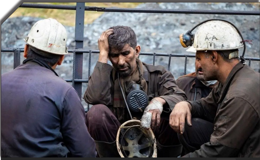
در سایت روزنامه بخت‌نویان

او به عدم افزایش حق مسکن در سال جاری اشاره کرده و می‌گوید: با حقوق فعلی کارگران تأمین مسکن به‌سختی انجام می‌شود و این موضوع باعث شده است که بخش زیادی از کارگران به حاشیه شهر مهاجرت کنند. این شرایط باعث می‌شود که موضوع تعیین حداقل دستمزد برای سال آینده، واردات تأثیر خواهد گذاشت و می‌تواند به افزایش قیمت کالاهای ضروری و