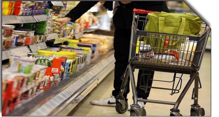
در سایت روزنامه بخوابند