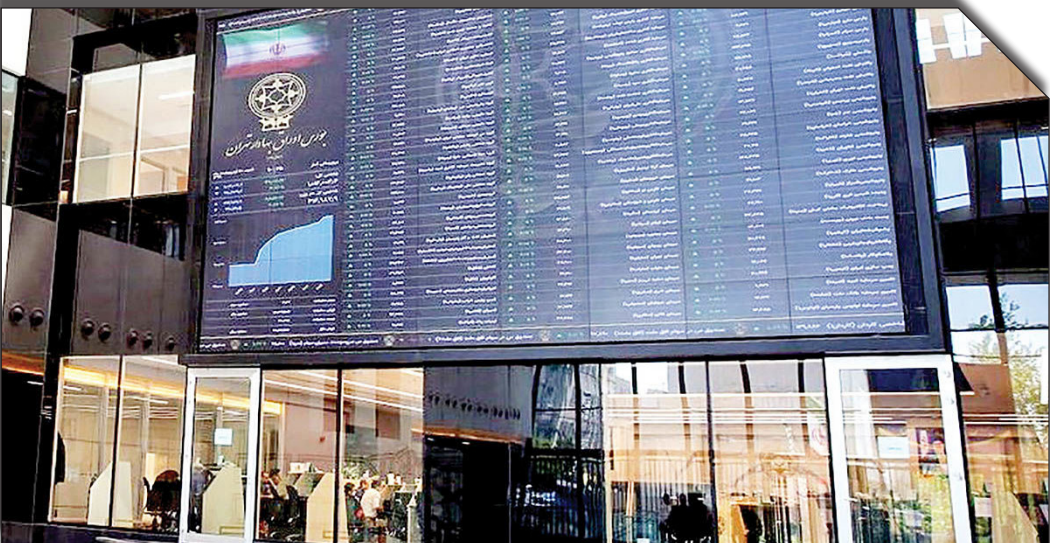
درصورت رونق‌نامه مطلوبیت

عصراققتصاد: بازار سرمایه ایران در سال‌های اخیر با چالش‌های متعددی مواجه بوده است؛ از نوسانات شدید اقتصادی گرفته تا تغییرات سیاست‌های مالی و ارزی. اما با ورود به فصل زمستان ۱۴۰۳، نشانه‌های مثبتی از شکوفایی در این بازار دیده می‌شود. آمارهای جدید نشان‌دهنده رشد شاخص‌ها، افزایش توجه سرمایه‌گذاران و تلاش‌های صورت‌گرفته برای تسهیل روند سرمایه‌گذاری است.