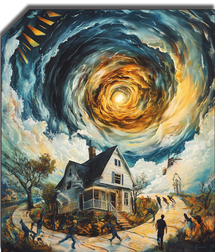
در مناطق شهری زندگی می

تغییرات، به‌ویژه در سال‌های اخیر، فشار زیادی بر طبقات متوسط و پایین جامعه وارد کرده است.