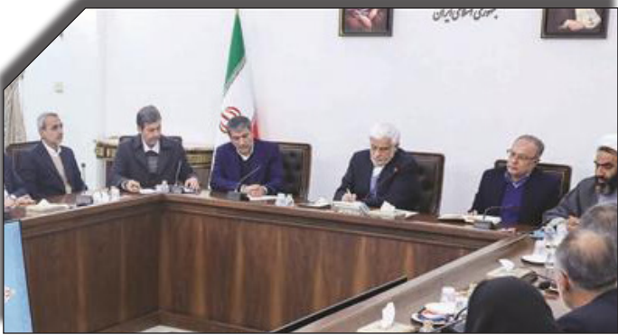
در راستای برنامه تحول دیجیتال

در این نشست نمایندگان استان اصفهان به تشریح مشکلات و دغدغه‌های خود در زمینه‌های احیای زاینده‌رود، حل مشکل آب استان، راه‌اندازی قطار سریع‌السیر تهران-اصفهان، نظارت بر قیمت آب شیرین پرداختند.