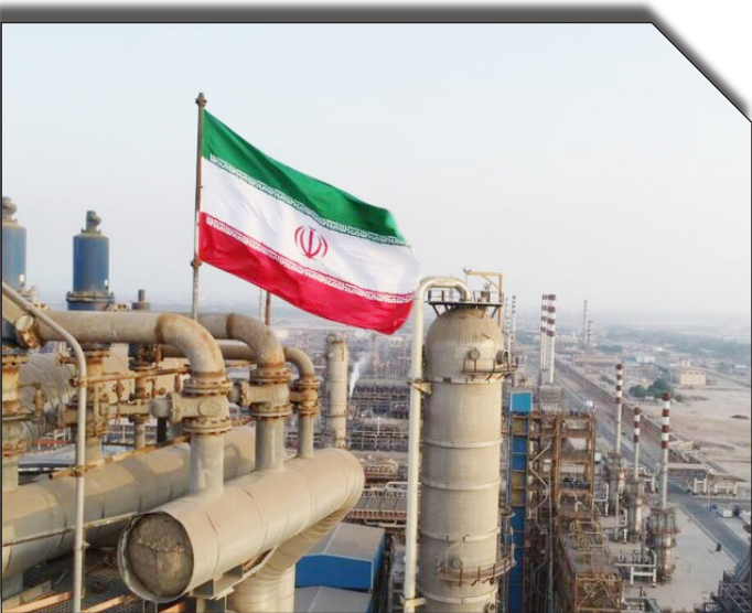
درگاه ویژه صادرات

خود کاسته و بازارهای جدیدی را هدف گذاری کنیم".