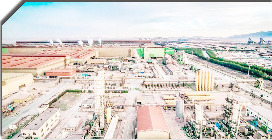
در سایت روزنامه بخت‌ناز