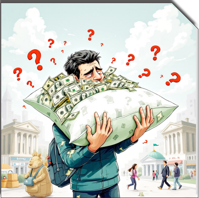
درصبات روزانه خوابش

حساب‌های ارزی، چالش‌های متعددی را به همراه داشته است. مشکلاتی مانند تبدیل ارز به ریال بدون اطلاع مشتریان و عدم تعهد به وعده‌های ارزی، از جمله مهم‌ترین دلایلی است که شهروندان را نسبت به سیستم بانکی بی‌اعتماد کرد.