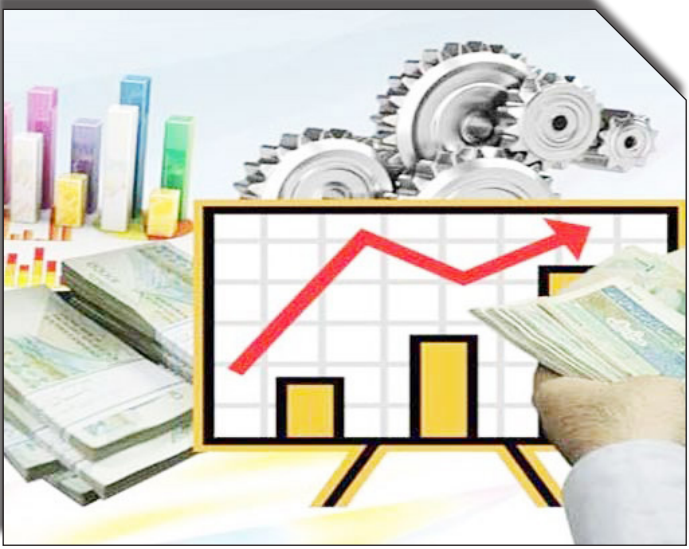
درصابت روزانه تولیدکنندگان