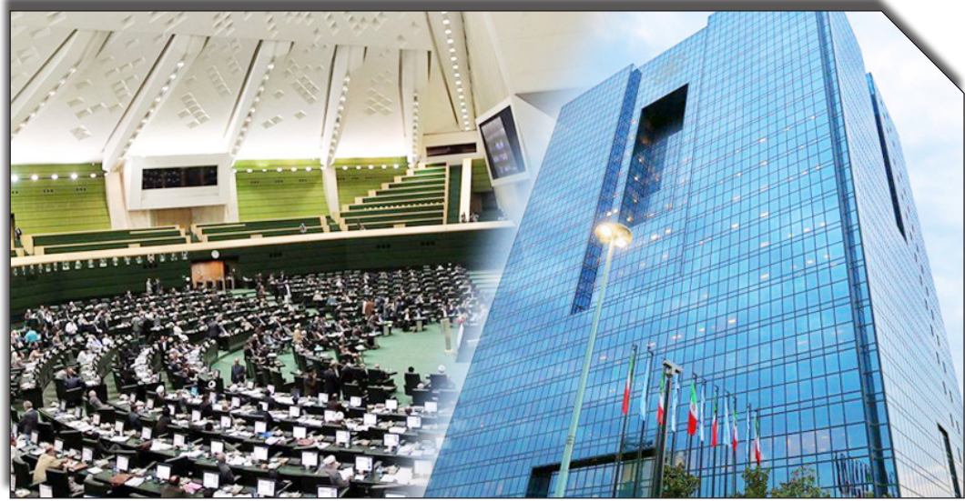
درصورت رونامه مجلس.