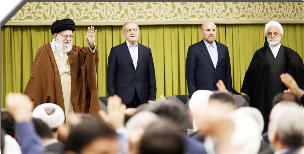
در سایت روزنامه بھوانید

بکارگیری عقل و ایمان، می‌توان از برکات و درس‌های آن در همه دوره‌ها برای ایجاد تحول فکری و عملی و اصلاح مشکلات استفاده کرد.