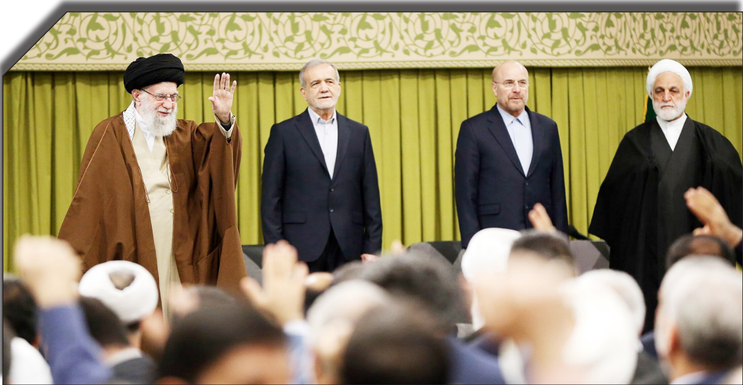
در سایت روزنامه بھوانید

گسترش نفوذ استعماری خود در حال نقشه کشیدن هستند و به تعبیر قرآن، هر چه شما را دچار مشکل کند آنها می‌پسندند.