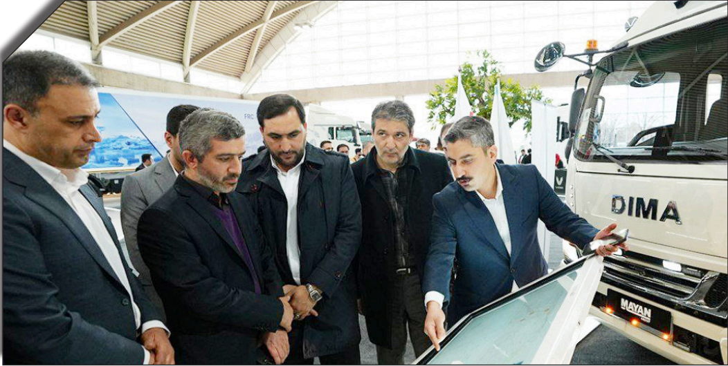
در دست رویتاره هوشمیت

مدیرعامل شرکت فولاد هرمزگان همچنین گزارشی از طرح‌های توسعه ای در دست اقدام این مجموعه فولادی به رییس جمهور کشورمان ارائه کرد و گفت: در حال حاضر شرکت فولاد هرمزگان در راستای تکمیل زنجیره تولید و افزایش حجم و سید محصولات خود، عملیات اجرایی چندین طرح توسعه‌ای به ارزش ۲ میلیارد و ۳۵۰ میلیون یورو شامل مدول سوم احیا مستقیم به ظرفیت ۱/۷۲ میلیون تن آهن اسفنجی، احیا مستقیم ستاره سیمین به ظرفیت ۱/۷۲ میلیون آهن اسفنجی، واحد دوم گازهای صنعتی به ظرفیت ۱۰ هزار نرمال مترمکعب بر ساعت، سیلوهای ذخیره‌سازی آهن اسفنجی، توسعه ظرفیت واحد فولادسازی تا ۳/۳ میلیون تن، احداث واحد ریخته‌گری و نورد پیوسته به ظرفیت ۱٫۷ میلیون تن، احداث واحد سوم