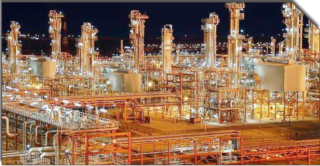
درگاه ویژه تولید

اشاره به چالش‌های جهانی و ناترازی انرژی در ایران، بر لزوم استفاده بهینه از منابع انرژی تأکید کرد. وی در سمینار فرهنگ‌سازی مصرف بهینه انرژی اعلام کرد که هم اکنون ۷۶ درصد از شرکت‌های پتروشیمی استانداردهای مصرف انرژی را رعایت می‌کنند. اما با اجرای ۱۳ راهکار جدید، هدف این است که تا پنج سال آینده، این میزان به ۱۰۰ درصد برسد.