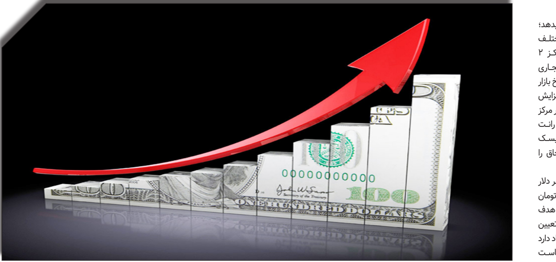
در سایت روزنامه‌خوب‌خبر

فاطمه مهاجرانی، سخنگوی دولت، اظهارات اخیر خود تأکید کرد که افزایش نرخ ارز یک پدیده تک‌عاملی نیست و تحت تأثیر جریان‌رات بین‌المللی و مسائل سیاسی، اقتصادی و اجتماعی قرار دارد. او همچنین به راندازی سامانه مبادله ارزی اشاره کرد و گفت که این سامانه به منظور قیمت‌گذاری ارز بر اساس عرضه و تقاضا ایجاد شده است.