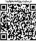
در سه ماهه پایانی سال ۲۰۲۴، اپل توانست عملکرد مالی فوق‌العاده‌ای را ثبت کند و برخلاف انتظار تحلیلگران، فروش خود را در سطح جهانی افزایش دهد. با این حال، این شرکت در یکی از بازارهای کلیدی خود، یعنی چین، با مشکلات جدی روبه‌رو بود و بیشترین کاهش فروش سالانه را تجربه کرد. این عملکرد ترکیبی از موفقیت‌های جهانی اپل و چالش‌های خاص در بازار چین را به‌طور روشن نشان می‌دهد.

رکوردشکنی در فروش جهانی و سودآوری طبق گزارش‌های مالی سه ماهه نخست سال مالی ۲۰۲۵ اپل، این شرکت در دسامبر ۲۰۲۴ با رشد چهار درصدی فروش نسبت به سال گذشته، به رقم چشمگیر ۱۲۴ میلیارد دلار دست یافت. این افزایش در فروش در حالی رخ داد که اپل بیشترین میزان سود خود را در تاریخ ثبت کرده بود و سود هر سهم به ۲.۴ دلار رسید که نسبت به سال گذشته ۱۰ درصد افزایش نشان می‌دهد. علاوه بر این، حاشیه سود ناخالص شرکت نیز به رقم بی‌سابقه ۴۶.۹ درصد رسید، که از پیش‌بینی تحلیلگران (۴۶.۵ درصد) فراتر رفته است.