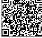
در ساعت روزانه به وقت

هوش مصنوعی (AI) به‌عنوان یکی از پیشگامان تحول دیجیتال، در حال تغییر ساختار بازار کار جهانی است. این فناوری با ارائه راهکارهای نوین، نه‌تنها به بهبود کارایی و دقت در بسیاری از حوزه‌ها کمک کرده، بلکه منجر به ایجاد مشاغل جدید و در عین حال، تهدیدی برای برخی حرفه‌های سنتی شده است. در این گزارش، به بررسی مشاغلی که با پیشرفت هوش مصنوعی پدید آمده‌اند و حرفه‌هایی که در معرض حذف یا تغییر قرار دارند، می‌پردازیم.