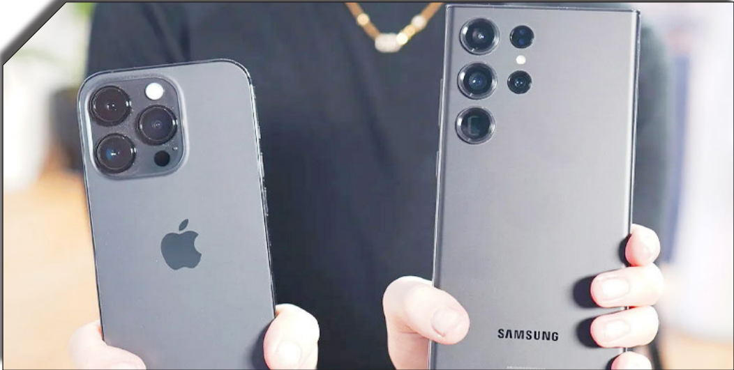
در ساعت روزانه به وقت

نیز با چالش‌های قضایی جدی روبرو است. وزارت دادگستری ایالات متحده پیش‌تر گوگل را به انحصارگرایی در بازار جستجو متهم کرده و پیشنهاد داده بود که مرورگر کروم از این شرکت جدا شود. این پیشنهاد با مخالفت شدید گوگل همراه شد. همچنین، مقامات آمریکایی در تلاشند تا قراردادهای انحصاری گوگل با شرکت‌هایی نظیر اپل و سامسونگ را لغو کنند. نکته جالب اینجاست که بیشتر خدمات گوگل در چین در دسترس نیست و موتور جستجوی این شرکت در این کشور فیلتر شده است. با این حال، گوگل همچنان با برخی شرکای داخلی چینی همکاری دارد و درآمدهایی از طریق تبلیغات در این بازار به دست می‌آورد. وزارت بازرگانی چین نیز چندین شرکت آمریکایی از جمله کلون پ‌وی‌اچ (PvH)، مالک برندهای کلون کلاب و تامی هالیفیگر، و شرکت فناوری زیستی Illumina را در لیست «نهادهای غیرقابل اعتماد» قرار داده است. بکن این شرکت‌ها را به اتخاذ سیاست‌های تبعیض‌آمیز علیه کسب‌وکارهای چینی متهم کرده و اعلام کرده که اقدامات آن‌ها به منافع شرکت‌های چینی آسیب زده است. شرکت‌هایی که به این لیست وارد می‌شوند با جریمه‌های سنگین و محدودیت‌های تجاری روبرو خواهند شد. از جمله این محدودیت‌ها، ممنوعیت تجارت، تعلیق چو‌ا‌و کاری کارکنان خارجی و سایر اقدامات تنبیهی است که می‌تواند تأثیر قابل توجهی بر فعالیت‌های آن‌ها داشته باشد.