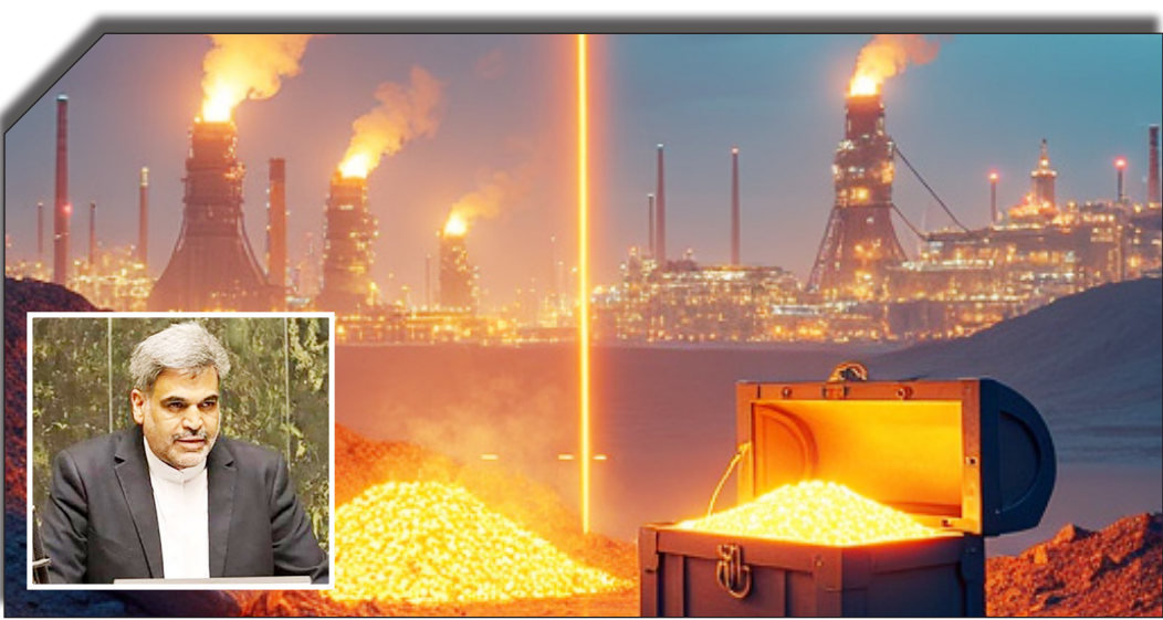
در سایت روزنامه بخت‌آید

دستوری نیست و مبتنی بر عرضه و تقاضا قیمت گذاری انجام می شود و فقط دولت ها ناظر بوده و سیاست های کلی را اجرا می کند، شیب تاثیر بازار تند نیست و درآمدها و هزینه های دولت تاثیر پذیری کمتر دارد ولی اقتصاد ایران به دلیل دخالت های دولت اینطور نیست.