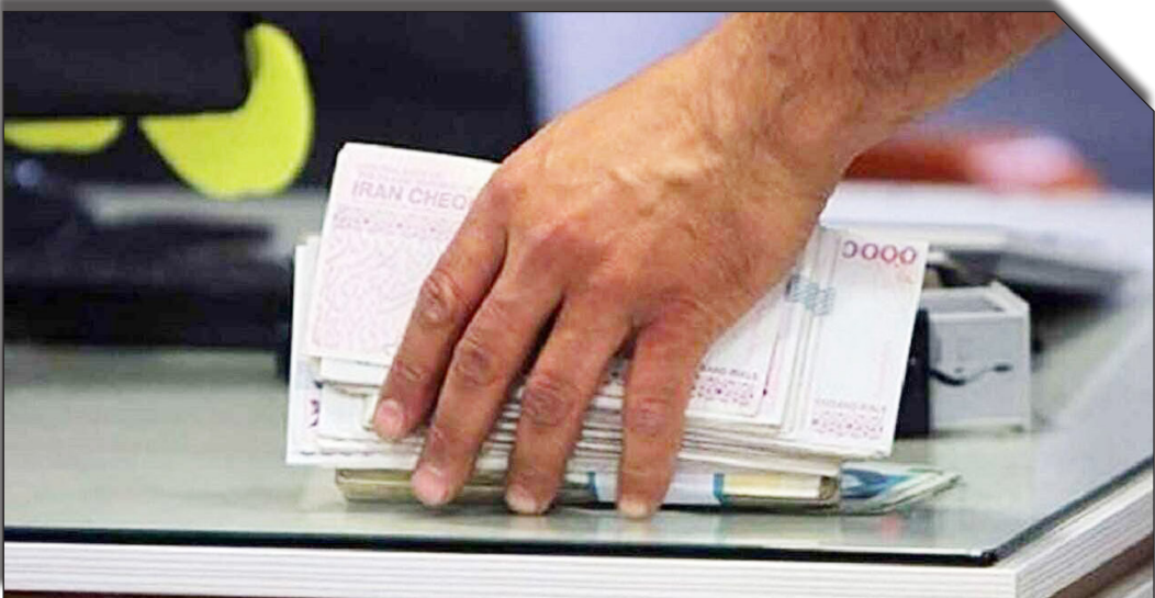
درسامت روزنامه بختولایت

تخصصی اقدامات عمل خوبی انجام نشده و الان بانک توسعه‌ای و تجاری فرقی با هم ندارند اما باید از هم تفکیک شوند و در آینده این آسیب برطرف شود