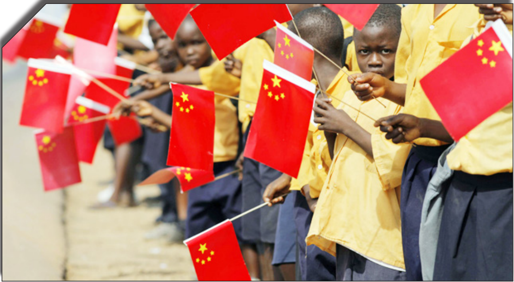
در سایت برنامه بخت‌بند

به سرزمین‌های خود و گسترش کنترل خود بر منطقه دریای چین جنوبی ایجاد کرده است، زیرا این کشور با این مسائل از منظر حاکمیت و امنیت ملی برخورد می‌کند.