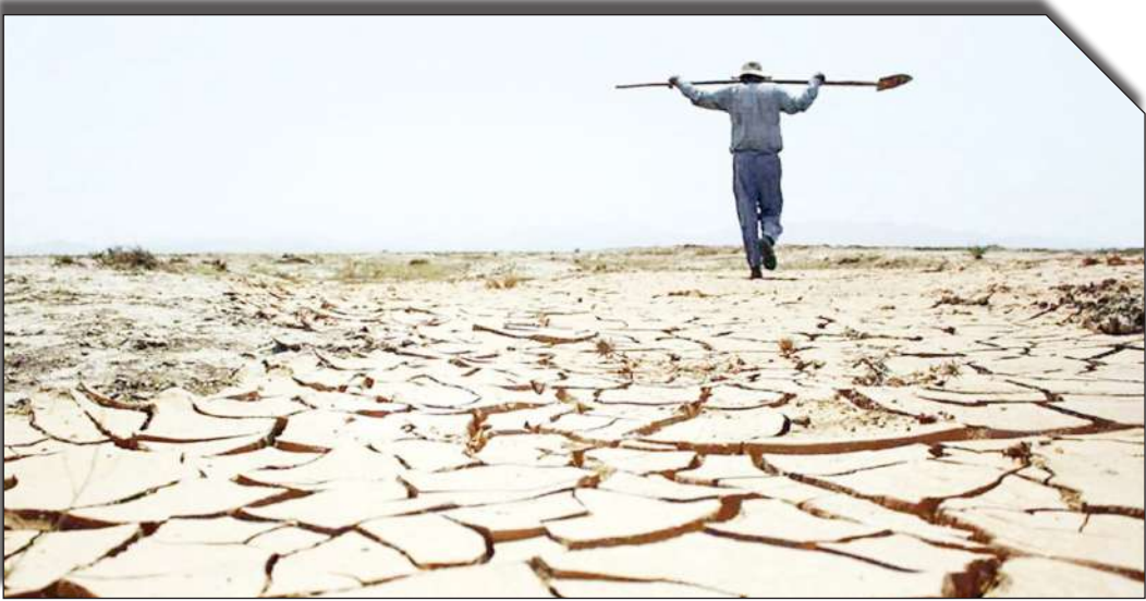
سد سات روزانه بخوابند

آینده به دلیل کم‌بارشی، سال سختی خواهد بود، گفت: «برنامه کوتاه‌مدت برای سال آینده تدوین شده و در هیئت دولت مطرح می‌شود تا از هم اکنون برای شهرهای دچار تنش آبی تدبیر شود.» وی افزود: «یک برنامه بلندمدت نیز برای سال‌های آینده در نظر گرفته شده است تا بتوان بحث آب را در کشور به نتیجه مطلوب‌تری رساند.»