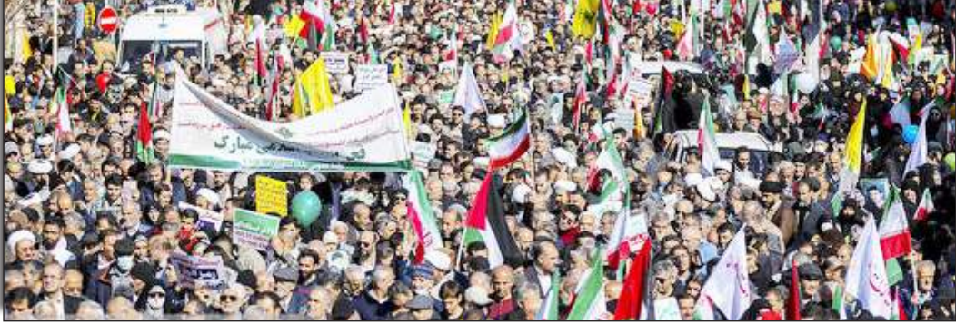
در سابت روزنامه بخوابید