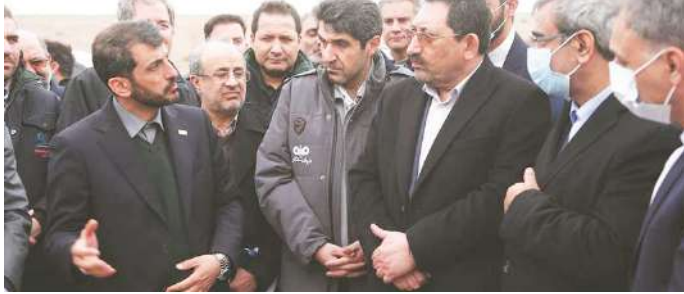
در ساید روزنامه‌نویسان

گفتنی است شرکت صنایع معدنی فولاد سنگان خراسان رضوی به‌عنوان یکی از شرکت‌های تابعه فولاد مبارکه در منطقه سنگان شهرستان خواف فعال است.