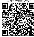
در سایه روزنامه بخونید

تحول در سازمان‌ها پرداخته و راهنمایی‌های ارزشمندی برای ایجاد سازمان‌هایی پویا و کارآمد ارائه می‌دهد.