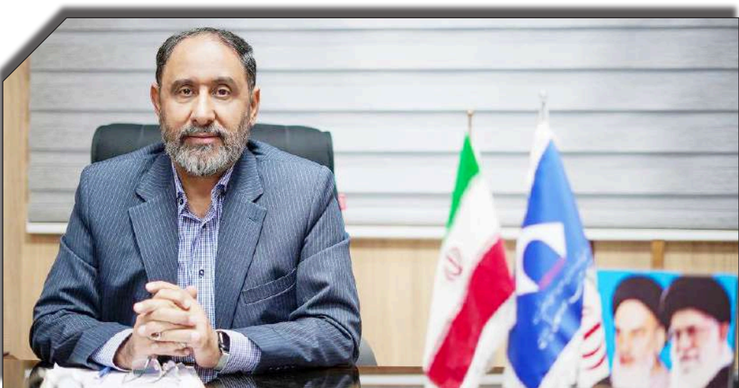
در ساید روزنامه‌نویسان

مغزه‌گیری در استان انجام شده که این رقم در مقایسه با مدت مشابه افزایش داشته است.