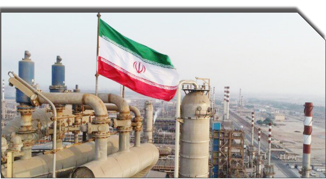
در سایت روزنامه‌هاپندار

زیست‌محیطی است. پژوهشگاه صنعت نفت در راستای اهداف بلندمدت خود، به‌دنبال همکاری‌های بیشتر با صنعت و دولت برای دستیابی به نتایج پایدار و مؤثر در حوزه انرژی است.