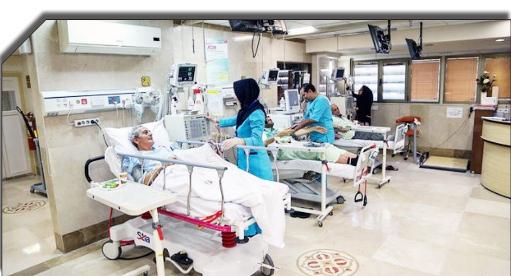
درسات روزانه خواباند

با پرداخت قبض‌های سرسام‌آور و اضافی جیب بیماران، قربانی کمبود بودجه در بیمارستان‌ها شده است