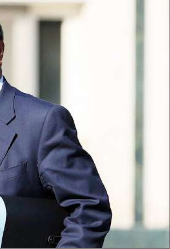
در سایه روزنامه‌خوابید

✓عبدالناصر همتی در دفاعیات خود موفق نشد مجلس شورای اسلامی را به بهبود وضعیت اقتصادی متقاعد کند و نهایتاً برکنار شد