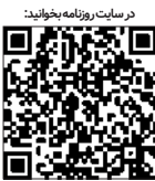
در سایت روزنامه بخت‌نازی

بازار جهانی نفت در سال ۲۰۲۵ همانند دریای متلاطمی است که فرصت‌ها و چالش‌های متعدد را با خود به همراه دارد. تحلیلگران معتقدند که آینده این بازار به طور گسترده‌ای به عوامل ژئوپلیتیک، تحولات اقتصادی، عرضه و تقاضا و سیاست‌های دولت‌ها وابسته خواهد بود. برخی امیدوار به شکل‌گیری دوره‌ای جدید از رونق در بازار نفت هستند، در حالی که گروهی دیگر نسبت به خطر مازاد عرضه و تأثیر سیاست‌های بزرگترین تولیدکنندگان جهانی نفت هشدار می‌دهند.