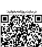
در سایت روزنامه بخت‌پوید