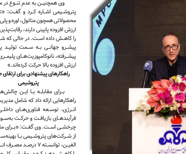
درصت روزانه تولید

مدیرعامل شرکت ملی صنایع پتروشیمی مطرح کرد