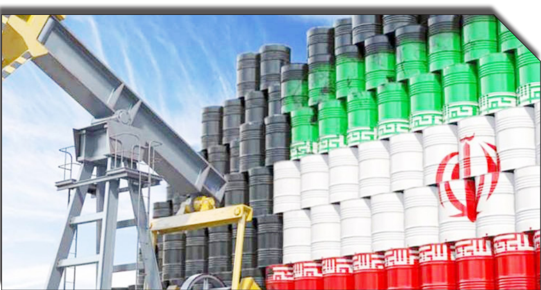
در ستان پروانه هوشمند

صنعت نفت ایران را متوقف کند، بلکه باعث تقویت اراده ملی شده‌اند.» احمدی همچنین اعلام کرد که کمیسیون انرژی مجلس و سایر نمایندگان با تمام قوا از وزارت نفت حمایت می‌کنند و این تحریم‌ها را فرصتی برای تقویت دیپلماسی انرژی ایران می‌دانند.