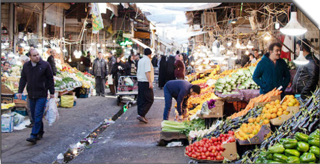
در سایت روزنامه‌هایخانتک

نرخ ارز کالاهای اساسی ثابت است در این رابطه، چندی پیش علی بهادری جهرمی، با بیان اینکه نرخ ارز تأمین کالاهای اساسی ثابت و به نرخ ۲۸ هزار تومان است، تأکید کرد: «گران‌فروشی به بهانه تغییر